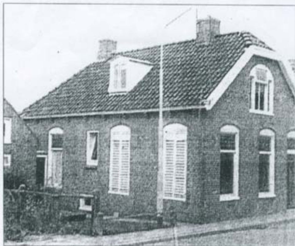
Zo stond het voormalige vissershuisje er ooit bij in Zoutkamp.

Woninkje wordt na herbouw aan toeristen verhuurd