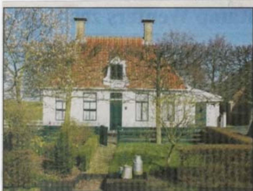
Gezocht: herinneringen aan dit Harlinger huisje voor kunstproject 'De Zouttocht'.