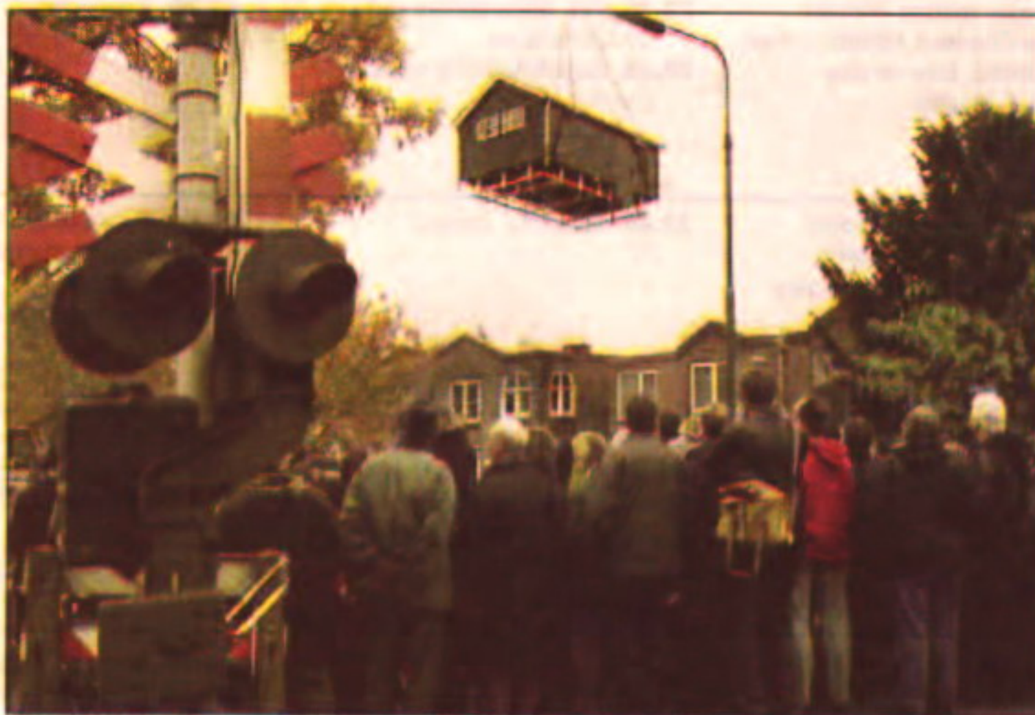
Een tuinhuisje in Abcoude wordt uit de tuin getild.