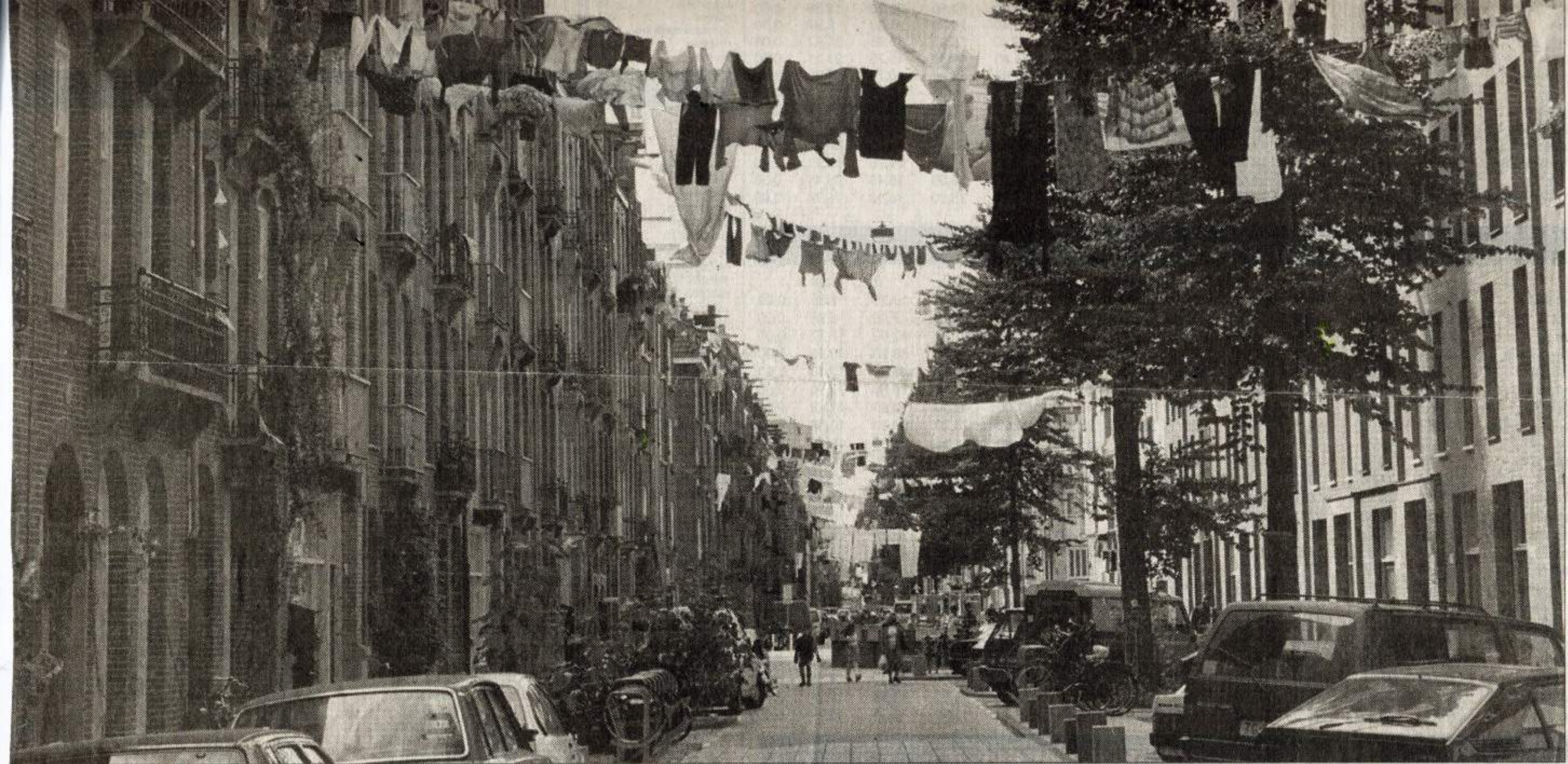
In het kader van een kunstproject hangt er drieduizend meter wasgoed boven de Amsterdamse Vrolijkstraat.