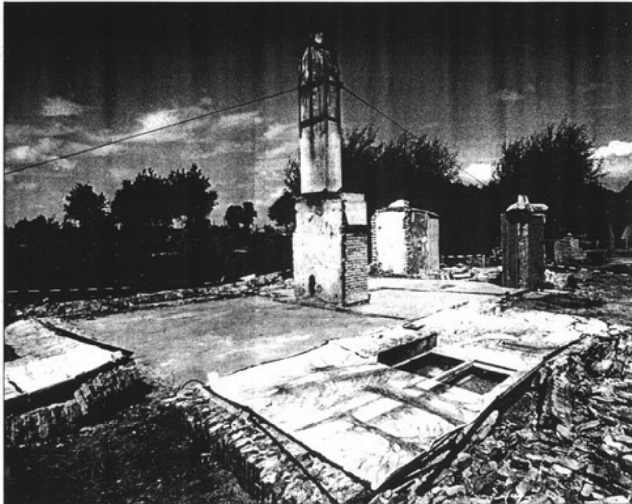
Het daglonershuisje in een van de laatste stadia van de sloop. De buitenmuren zijn als de zijden van een kartonnen doos naar buiten gedrukt.

Het project is opengesteld voor publiek, do-vrij van 14-17.00 uur, en zat van 11-15.00 uur. Lokatie: Oud Aa 26, Breukelen.